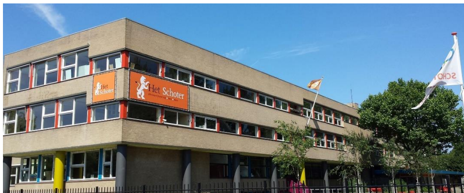
Ons schoolgebouw aan de Sportweg 9 in Haarlem.

Op onze site staat alle informatie over onze school: missie, visie en onderwijskundig concept, de laatste nieuwtjes en heel veel praktische informatie (bereikbaarheid, financiën, aanmelden, et cetera). Ook is er een aparte rubriek “voor groep 8”.