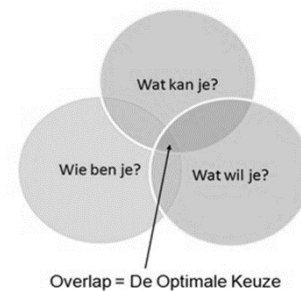
Afb. 1. Kernvragen

Om jezelf te leren kennen, is het van belang dat je een realistisch beeld hebt van jezelf, dat je weet wat je interessant vindt en wat jou motiveert. De kernvragen die hierbij horen zijn 'Wie ben je?', 'Wat kun je?' en 'Wat wil je?' (zie afbeelding 1). Bij het 'zijn' gaat het om persoonlijke eigenschappen als nauwkeurigheid en of je je gemakkelijk aan kunt passen aan een situatie. Bij het 'kunnen' gaat het om vaardigheden en talenten. Ben je bijvoorbeeld goed met cijfers of kun je makkelijk voor een groep spreken? Tot slot gaat het bij 'willen' om je toekomstige ambities. Waar zie jij jezelf later werken en aan welke voorwaarden moet jouw ideale baan voldoen? De beste match, is die studie of baan waar de meeste van deze punten samenkomen.