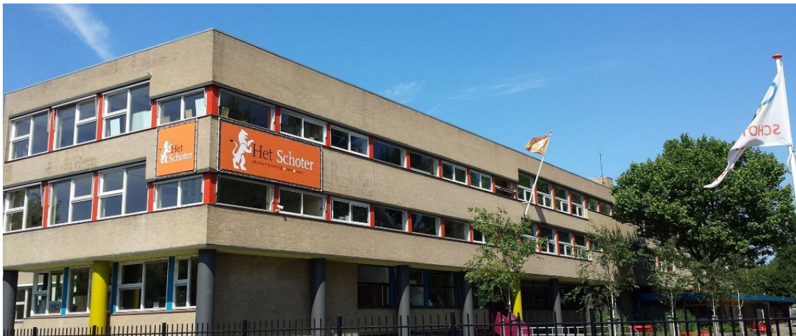
Ons schoolgebouw aan de Sportweg in Haarlem.

Op onze site staat alle informatie over onze school: missie, visie en onderwijskundig concept, de laatste nieuwtjes en heel veel praktische informatie (bereikbaarheid, financiën, aanmelden, et cetera). Ook is er een aparte rubriek “voor groep 8”.