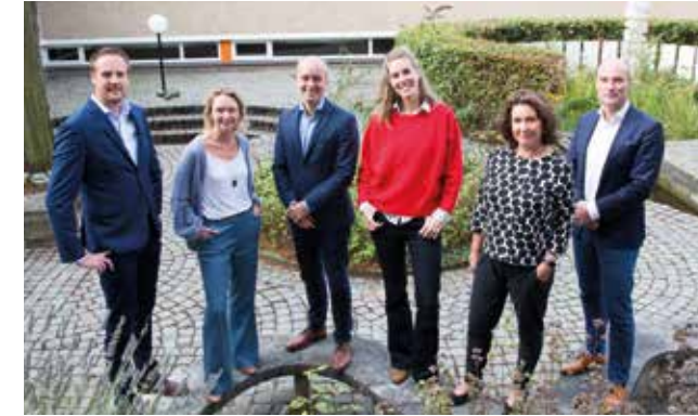
De schoolleiding van Het Schoter

Op Het Schoter zien we het als onze voornaamste taak om alle leerlingen goed voor te bereiden op de rest van hun leven. Dat betekent dat we alle leerlingen zoveel mogelijk kansen bieden om zich als persoon te ontwikkelen, dat we hen optimaal uitdagen tot een leven lang leren en dat we hen willen voorbereiden op het functioneren in een complexe en multiculturele en internationale omgeving. Die opdracht komt terug in de wijze waarop we onze onderwijskundige visie, onze pedagogische visie en onze burgerschapsvisie hebben geformuleerd.